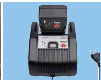
Chargeur rapide 60 min. Température de charge entre -10 °C et +65 °C. Batterie avec indicateur de charge.