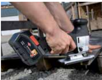
Sciage de bois avec clous.