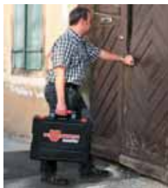
Coffret MASTER System.